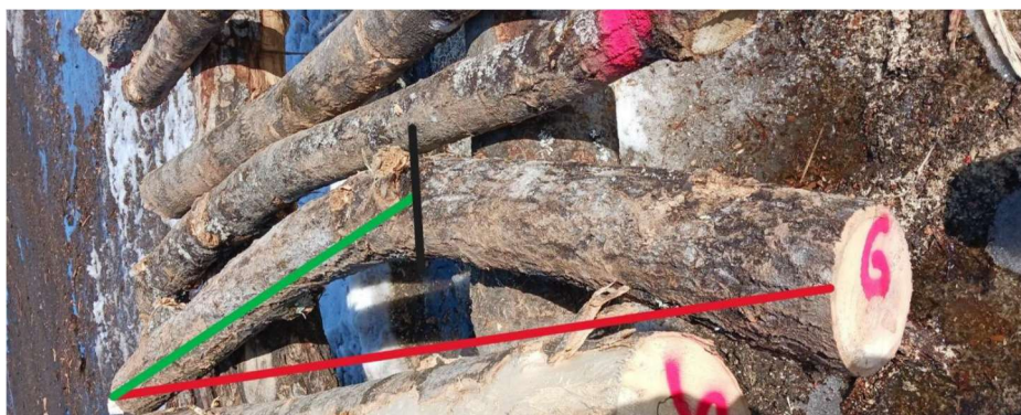
Fourche et nœud mal rasé