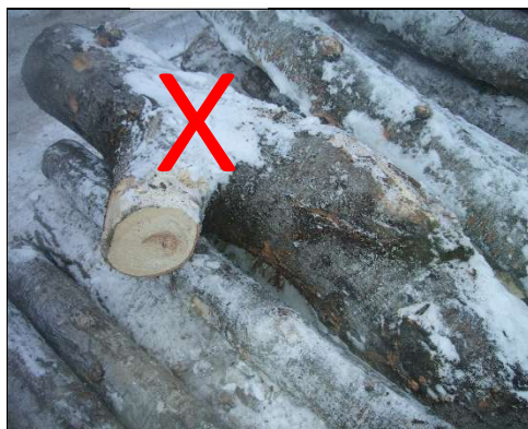
Fourche et nœud mal rasé